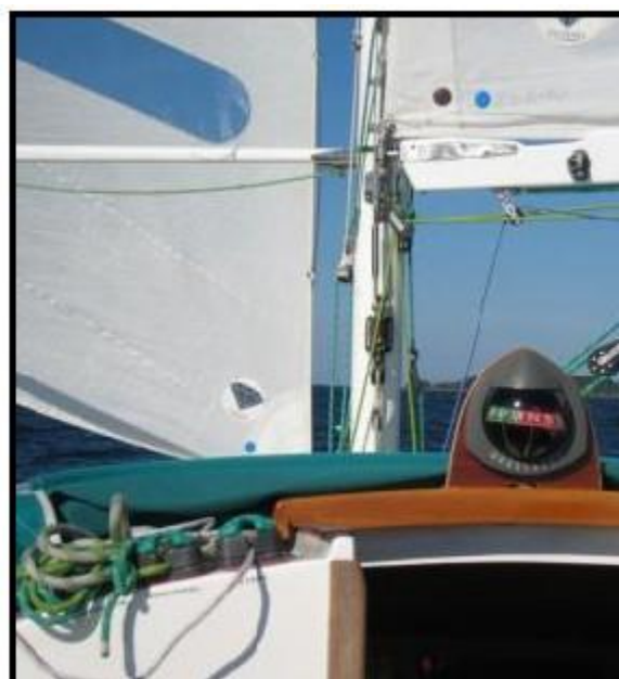
Strøm om bord Det