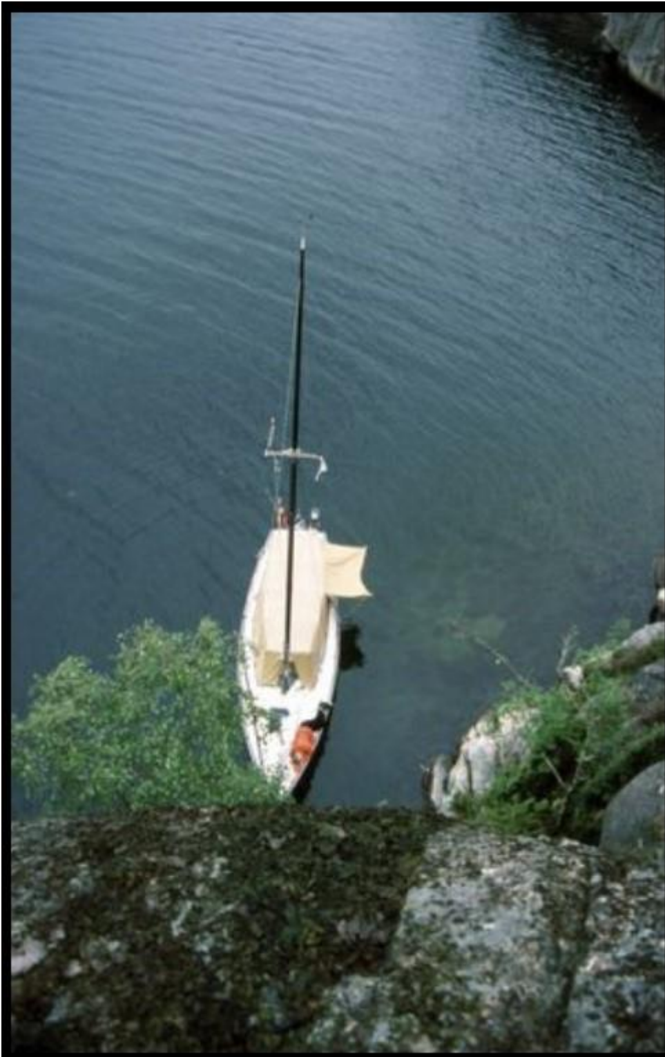
Skærgården ved Orust